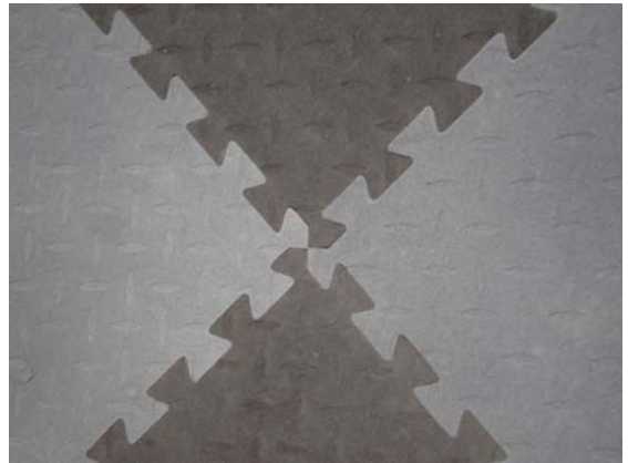
Posibilidad de combinación de colores