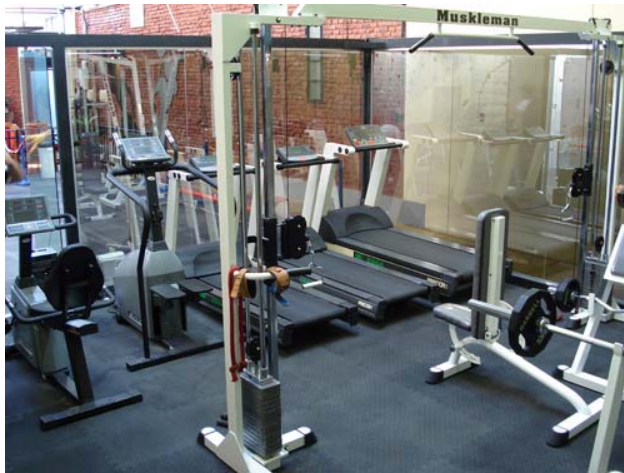
Muestra de colocación en un gimnasio